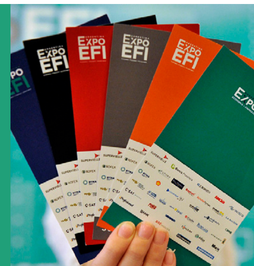
Imagen del evento