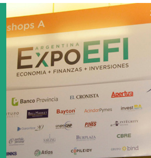
Imagen del evento