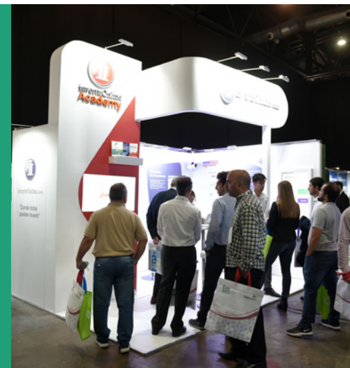
Imagen del evento Campaña publicitaria Campaña digital: redes sociales. Sitio Web Mailing semanal a base de datos de más de 50.000 contactos Flyers, comunicación digital, banners