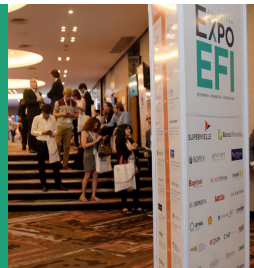
Imagen del evento